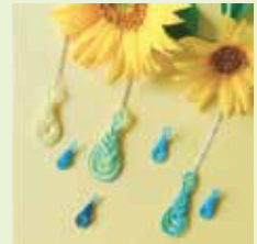
※作品例 (講師作品と見本展示中)