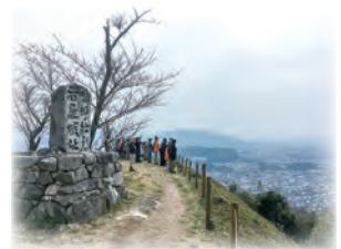
岩屋城跡からの景色(太宰府市内) プラム・カルコア太宰府から見えます!