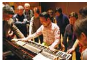
ピアノ解体ショー