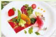
<根菜・つぼみ野菜のサラダ>