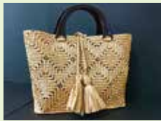
<見本展示中> サイズ30×22cm