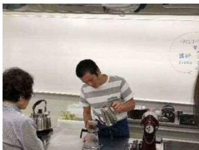
アイスコーヒーの楽しみ方

約 50 種類のカラー水引の中から、好きな配色で普段使いのアクセサリーを作りました。