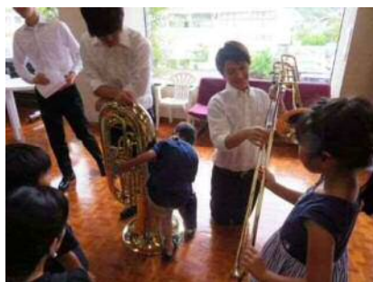
こどものための夏の終わりの音楽会