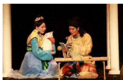
史跡のまちの“生”歴史ドラマ

実力派若手演奏家が中学校等へ出向き、交流を交えた訪問演奏及び、プラム・カルコア太宰府でのコンサートを開催しました。