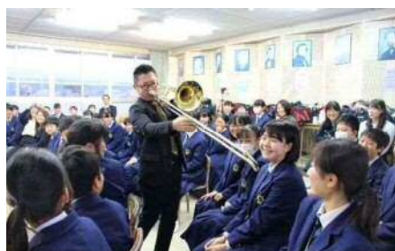
史跡のまちの音楽隊

実力派若手演奏家が中学校等へ出向き、交流を交えた訪問演奏及び、プラム・カルコア太宰府でのコンサートを開催しました。