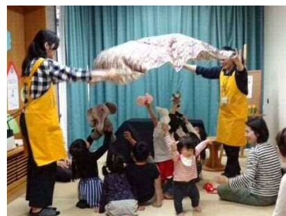
ぬいぐるみのおはなし会 （「おはなしの広場」にて）