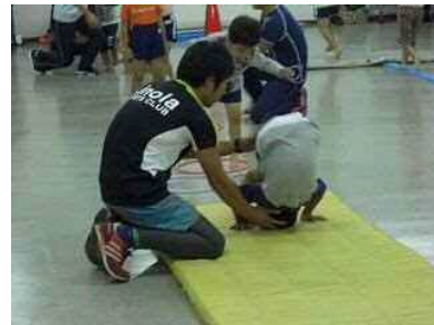
わくわく子ども体操

ストレッチ、マット運動、跳び箱などで、体操の基本となる筋力や柔軟性を身に着けました。