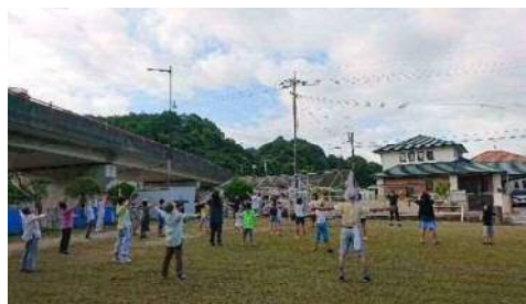
史跡のまちのラジオ体操

市内スポーツ施設を活用し、スポーツの楽しさやふれあいを体験するイベントを開催しました。