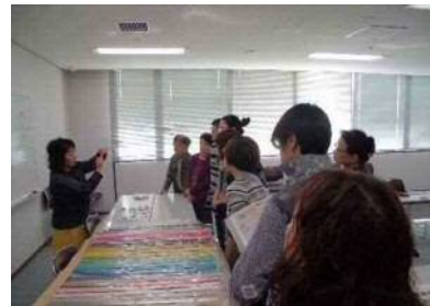
水引きアート*アレンジアクセサリー

約 50 種類のカラー水引の中から、好きな配色で普段使いのアクセサリーを作りました。