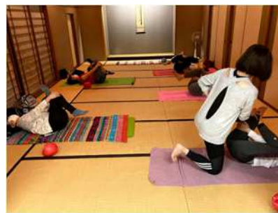
骨盤調整★エクササイズ

女性特有の不調の軽減に役立ち、体の調子が良くなり、楽しく受講できたという感想を沢山いただきました。