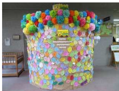
移動図書館すくすく号40周年

運行40年を迎えた移動図書館「すくすく号」に利用者の皆さんからたくさんのメッセージが寄せられました。