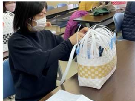
PPテープで作るかごバッグ

軽くて暖かいベストが出来上がり、新しい編み方の技法を習得できて楽しかったという感想をいただきました。