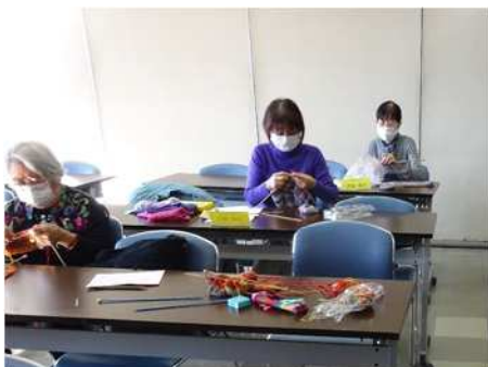
編み物を楽しむ（冬）

軽くて暖かいベストが出来上がり、新しい編み方の技法を習得できて楽しかったという感想をいただきました。