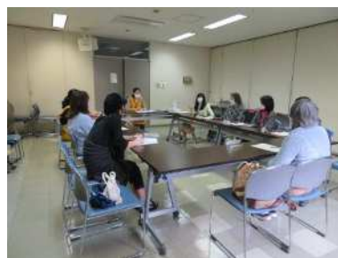
図書館ボランティア交流会

3年ぶりの開催となり、皆様のご意見をお聞きでき、とても有意義な時間になりました。