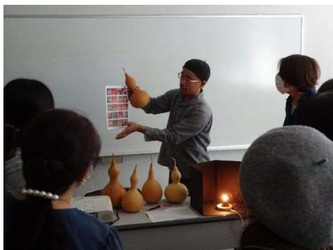
ひょうたんランプ

一粒の種から大切に育てられたひょうたんを味わいのあるランプシェードに作り変えました。