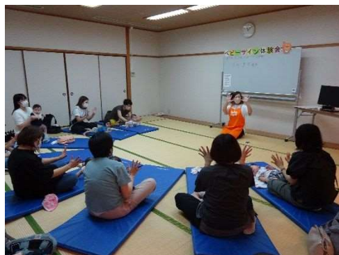
絆深めるベビーサイン体験

言葉を話し始める前の赤ちゃんと簡単な手の動きを使って「お話し」する方法を親子で学びました。