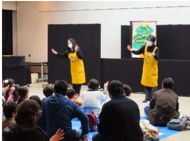
中学生の職場体験