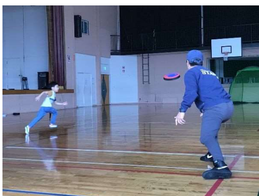
ドッジビー体験会

柔らか素材でできたフライングディスク「ドッジビー」、太宰府市在住の元世界チャンピオンから基礎を学びました。