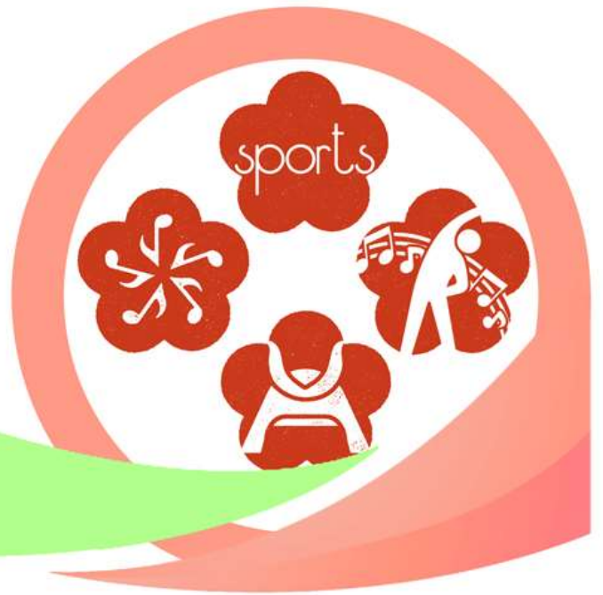
史跡のまちの音楽隊