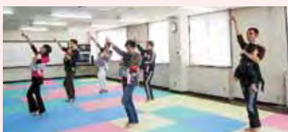
<前年度 講師と受講生>