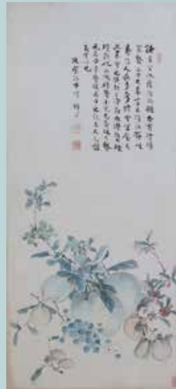
吉嗣拝山筆 《花卉鳥獸押絵貼屏風》

★関連イベント（主催 文化ふれあい館） マヂカで秋圃 —齋藤家資料特別観覧— 6月26日（土）10:00～11:30、14:00～15:30 ※詳細は文化ふれあい館にお問合わせ下さい