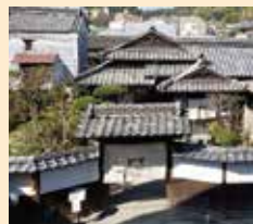
ホテルカルティア太宰府 (吉嗣家旧宅「古香書屋」)