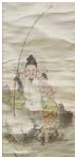
(左) 三条町に建つ えびす石像 (吉嗣梅仙筆)