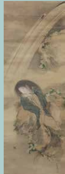
齋藤秋圃筆《菊慈童図》