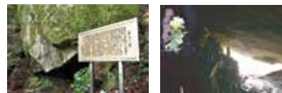
夢想権之助が修行をし、ご神託を受けたと言われている 宝満山中にある「普池の窟」。

太宰府市景観・市民遺産会議議長 宝満山、太宰府の歴史に関する著 書に「宝満山歴史散歩」「太宰府発 見－歴史と万葉の旅－」など多数。