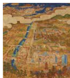
和田三造「西都政庁の図」 福岡市美術館蔵

太宰府史跡水辺公園の屋内プールに、タイル製の大きな壁画があるのをご存知でしょうか。中央に古代の大宰府政庁が描かれ、雲の向こうの博多湾には帆船が浮かび、鴻臚館が見えます。いにしえの大宰府の風景を、まるでドローンでとらえたようなこの絵は、福岡ゆかりの作家・和田三造(1883-1967)が昭和33年に発表した「西都政庁の図」。平成4年のプール開館時に原画の一部がレリーフになったものです。ここでは、絵にまつわる物語をご紹介します。