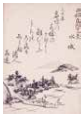
「西都旧跡十二景」より水城 福岡市博物館蔵