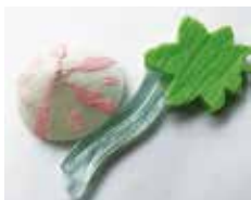
季節のお菓子 (菅笠、水、青葉)