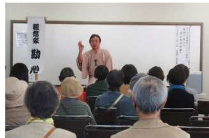
ルミナス感謝 Weeks 講演会 落語「笑顔で語ろう男女共同参画」

ユーモアを織り交ぜた落語で笑いあり、楽しく男女共同参画について理解することができました。