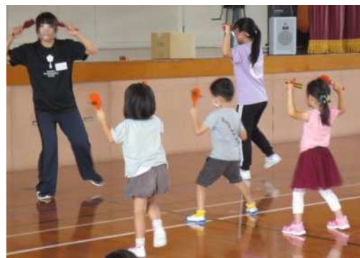
子どもよさこい体験

子ども向け楽曲に合わせて「よさこい」を踊り、子供達にリズムに合わせて踊ることの楽しさを知ってもらいました。