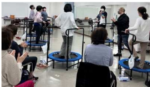
健康トランポリン体験

トランポリンを使って足踏みやジャンプな どの軽運動をしながら、ストレッチや脳トレ を行いました。