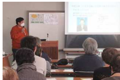
<男女共同参画セミナー③> 父親であることを楽しもう!!

パートナーシップを理解し、お互い無理なく思いやり寄り添い合い、質より量を目指しましょう。父親が笑うだけで人生が変わります。価値観が変わります。人生が楽しくなります。と話されました。