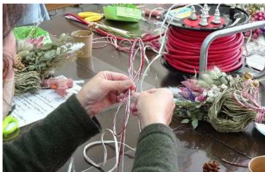
華やかにお正月飾り

ドライフラワーの花材を水引きなどで 飾り、新年の幸を願う和モダンなしめ 縄を作りました。