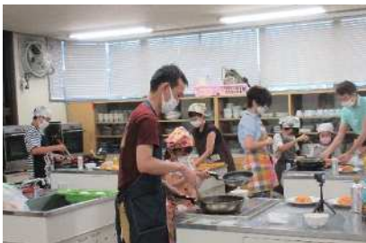
夏休みにパパと作ろう！ ふわとろオムライス

「“おとう飯”始めよう」キャンペーン参加事業として開催。ふわとろオムライスの他にコールスローサラダやミルクプリンを親子で協力して楽しく作りました。