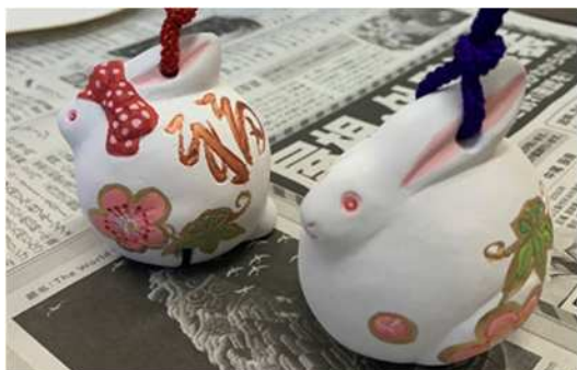
博多人形千支の絵付け体験

博多の伝統工芸品の一つ。「博多人形」 の素焼きをベースに色付けをし、オリ ジナルの千支人形を作りました。