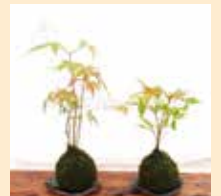
<画像は11月頃のイメージです>