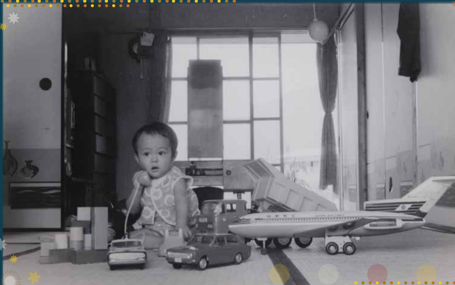
▲ おもちゃの電話で「こんにちは」

わたしたちのまちやくらしが、どのようにかわってきたのか、ちょっとのぞいてみましょう。