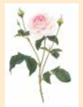
<見本作品は水彩画です> —講師作—