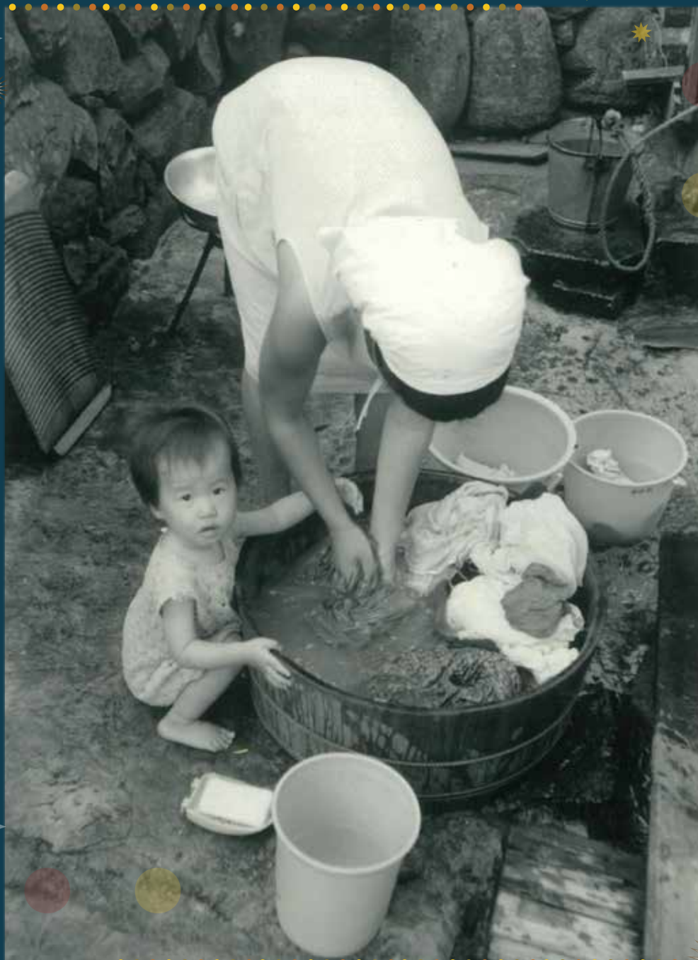
▲一緒にお洗濯

わたしたちのまちやくらしが、 どのようにかわってきたのか、 ちょっとのぞいてみましょう。