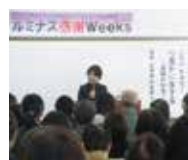
男女共同参画講演会

当館はこれからも、みなさまの生活に光り輝く時間をプラスし、男女共同参画の和を広げる拠点として、各種事業や情報発信、交流の機会を積極的に提供して参ります。