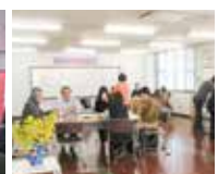
おしゃべりカフェ